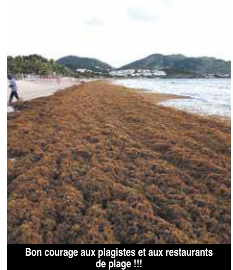
Bon courage aux plagistes et aux restaurants de plage !!!

Du côté de l'Etat, on nous confirme le soutien toujours en cours envers le centre Symphorien d'insertion, à travers une vingtaine de contrats aidés pour former les brigades vertes qui effectuent le ramassage des sargasses. La Préfecture informe par ailleurs qu'une campagne de communication est en cours de réalisation, notamment à l'endroit des restaurateurs situés sur la plage de la Baie Orientale, fortement impactée, afin que chacun procède à un nettoyage en profondeur de leur site. La Collectivité à qui revient la compétence de l'environnement, mais aussi celles de l'économie et du tourisme, des secteurs directement impactés par ce fléau, n'a pour l'heure fait aucune communication sur cette nouvelle vague de sargasses. Contacté également, l'Agence Régionale de la