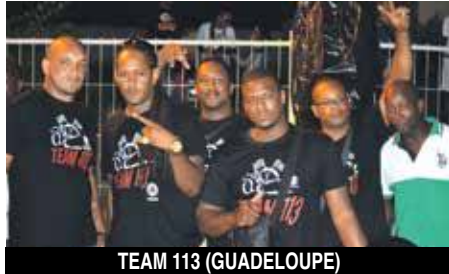
TEAM 113 (GUADELOUPE)

Les organisateurs de la compétition, l'association Moto Action du Nord (Aman), assistés par les officiels de la Fédération Française de Motocyclisme (FFM), avaient tout prévu pour que la compétition se déroule dans les meilleures conditions.