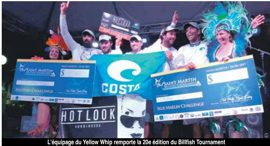
L'équipage du Yellow Whip remporte la 20e édition du Billfish Tournament

Dès le premier jour, l'équipage saint-martinois du Yellow Whip a ramené un marlin bleu de 451 livres. Ce sera l'unique marlin pêché et amené au portique de pesée durant tout le tournoi.