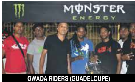
GWADA RIDERS (GUADELOUPE)

Passionnés ou simples curieux, le public était venu en nombre assister à la seconde manche du championnat Run 2017 samedi dernier sur la route de Grand Case, convertie pour l'occasion en piste de course.