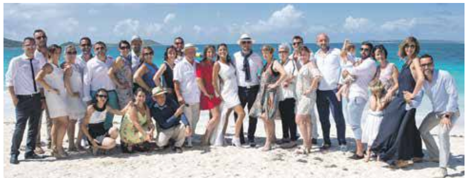
La family avec tous les potos de France