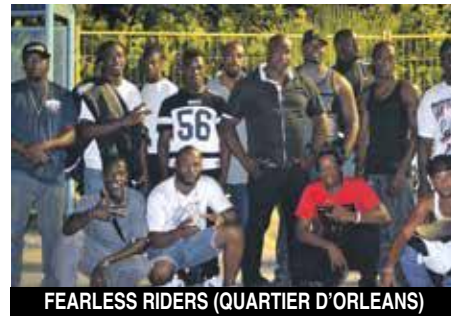
FEARLESS RIDERS (QUARTIER D'ORLEANS)