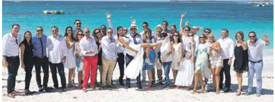
La Team Saint Martin avec les jeunes mariés