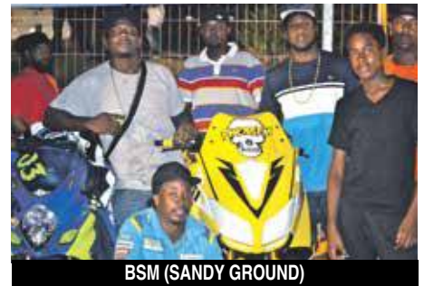
BSM (SANDY GROUND)