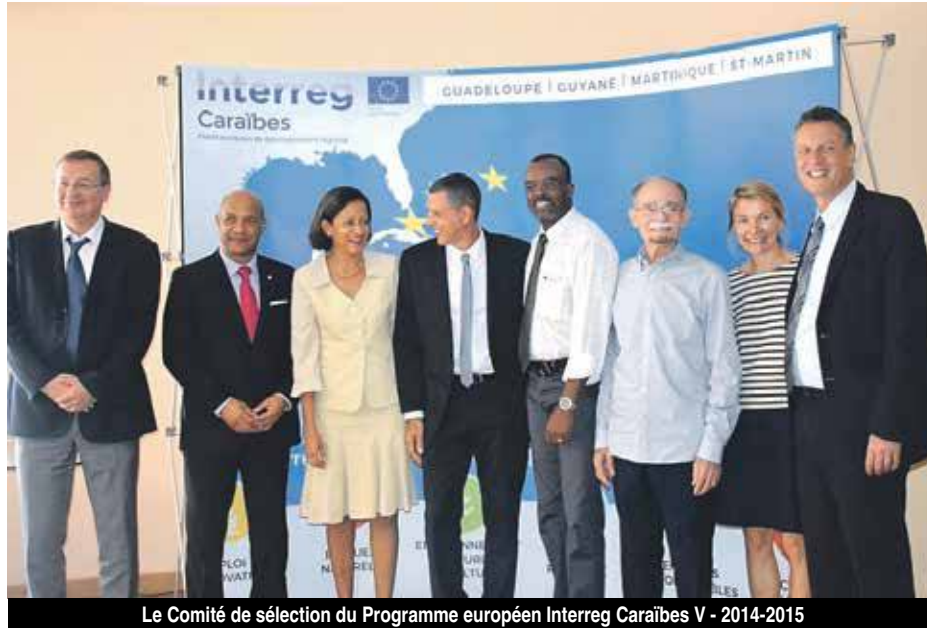
Le Comité de sélection du Programme européen Interreg Caraïbes V - 2014-2015

Parmi les grands enjeux du programme 2014-2020, les pays partenaires doivent notamment renforcer la compétitivité des entreprises par la mise en œuvre de projets conjoints, augmenter la capacité de réponse aux risques naturels par l'amélioration des connaissances et la mise en place de systèmes communs de gestion, améliorer la gestion des espaces vulnérables ou protégés en développant conjointement un tourisme durable;