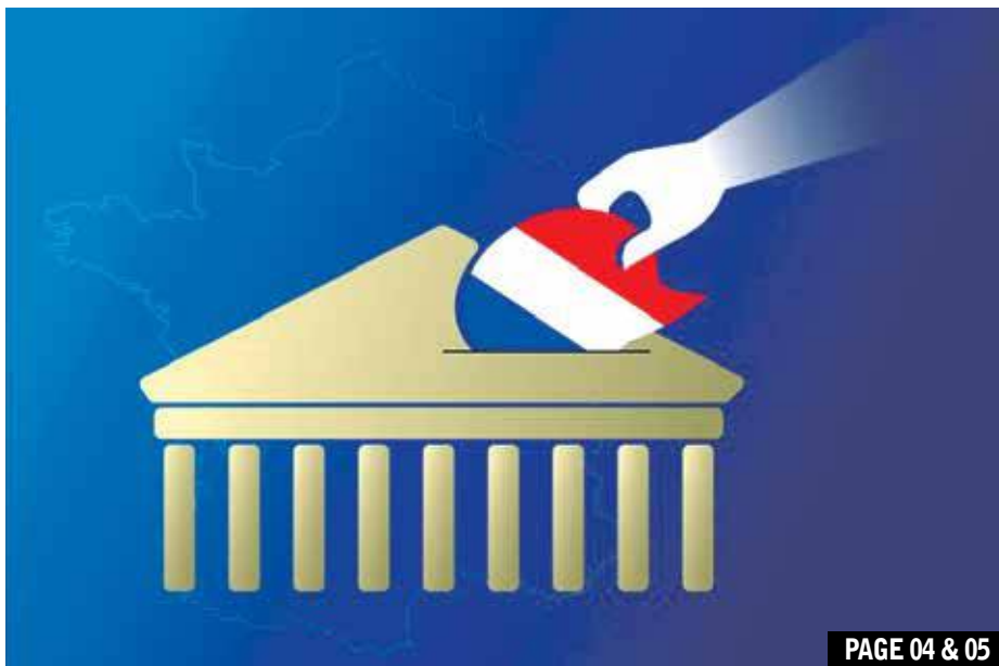
PAGE 04 & 05