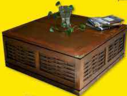
Table -40% 69€ 41€ 99

CARACAS ENSEMBLE DE JARDIN, piètement en métal peint, assise en corde de PVC : • FAUTEUIL, L80 H80 P70 cm. 142145 • TABLE, plateau en verre, Ø50 H50 cm. 142146