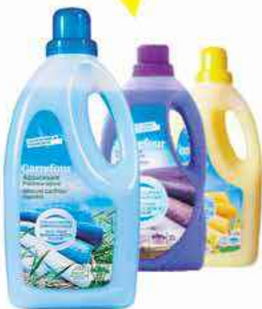
Adoucissant Carrefour 2l différents parfums au choix