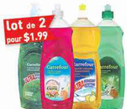
lot de 2 pour $1.99 Liquide vaisselle Carrefour 750ml, différents parfums au choix