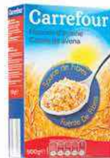
Flocons d'avoine Carrefour 500g