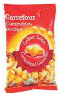
Cacahuètes Carrefour 500g