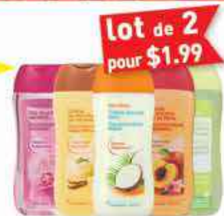
lot de 2 pour $1.99 Gel ou crème de douche Carrefour 250ml, différents parfums au choix