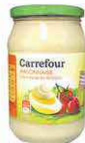
Mayonnaise Carrefour 718g