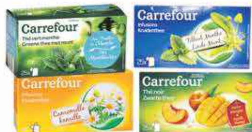
Infusion ou thé vert Carrefour 25 sachets, différents parfums