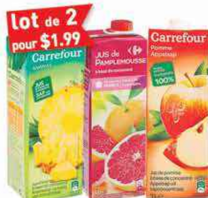
lot de 2 pour $1.99 Jus Carrefour 1L, différents parfums