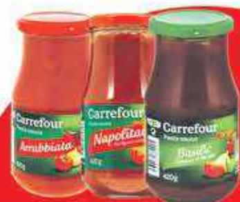
Sauce Carrefour 420g, différentes recettes

lot de 1 sauce + 1 paquet de pâtes pour $1.99