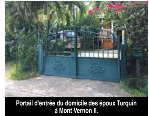
Portail d'entrée du domicile des époux Turquin à Mont Vernon II.

Pour mémoire, le vétérinaire avait été condamné en 1997 par la cour d'assises de Nice à 20 ans de réclusion criminelle pour l'as-