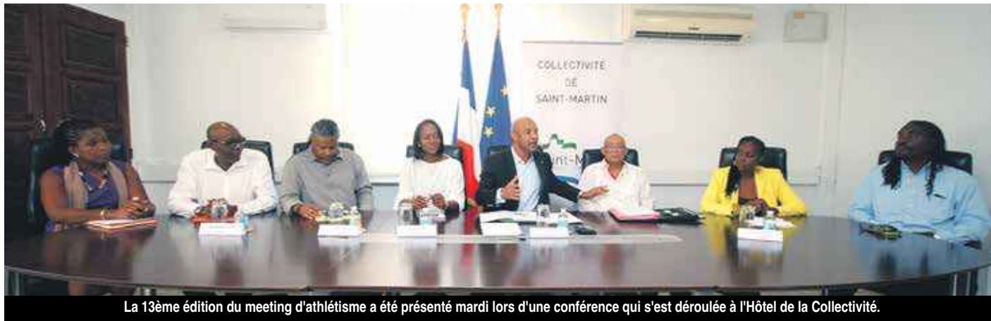
La 13ème édition du meeting d'athlétisme a été présentée mardi lors d'une conférence qui s'est déroulée à l'Hôtel de la Collectivité.