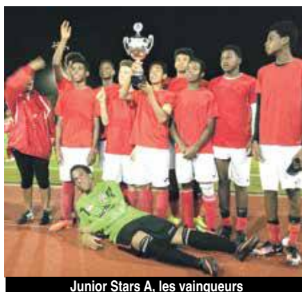
Junior Stars A, les vainqueurs

Le club organisateur remercie toutes les personnes qui ont participé, de près ou de loin, à cette première édition du Tournoi Albert Fleming, et notamment le corps arbitral, tout en donnant rendez-vous à l'année prochaine pour la seconde édition du tournoi. Roger Masip