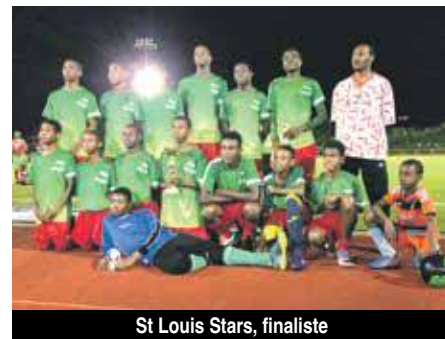
St Louis Stars, finaliste