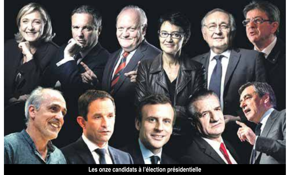
Les onze candidats à l'élection présidentielle

Si la campagne pour l'élection du Président de la République Française est totalement absente sur la partie française de Saint-Martin (...), il est toutefois de bon ton de rappeler que les élections auront lieu la veille des journées d'élection dans l'Hexagone, soit le samedi 22 avril, pour le premier tour et le samedi 6 mai, pour le second tour.