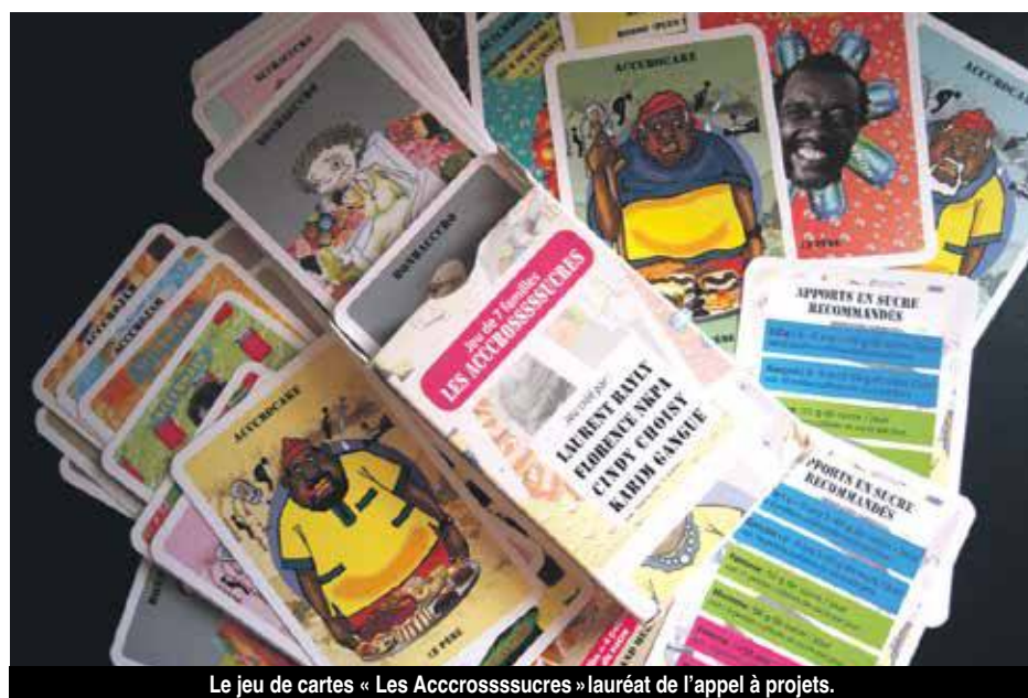
Le jeu de cartes « Les Accrosssucs » lauréat de l'appel à projets.

Si le jeu a reçu un accueil favorable, il y avait toutefois quelques problèmes de pédagogie, « les indications thérapeutiques mises dans le jeu n'étaient pas tout à fait adaptées pour qu'il soit utilisable, et surtout que les enfants apprennent des choses, au lieu de jouer simplement à un jeu de cartes ».