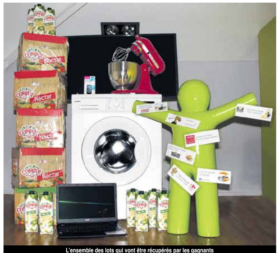
L'ensemble des lots qui vont être récupérés par les gagnants