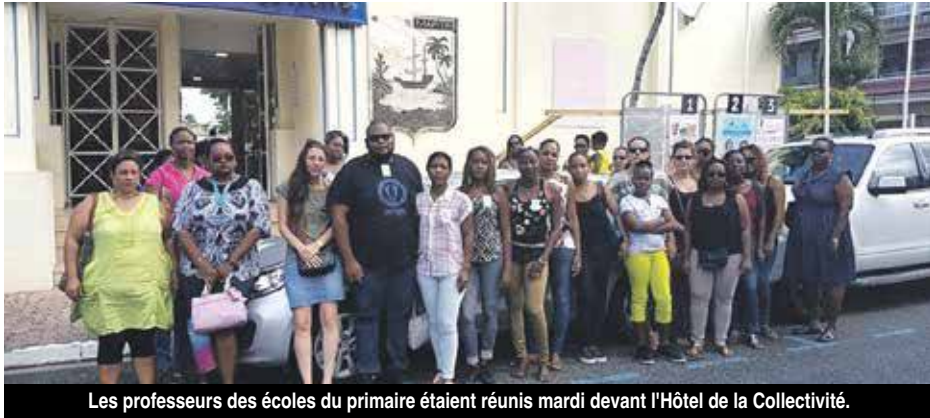
Les professeurs des écoles du primaire étaient réunis mardi devant l'Hôtel de la Collectivité.

Le mouvement de grève des enseignants du premier degré initié à l'appel du syndicat guadeloupéen, le SNUipp-FSU, qui a eu lieu mardi dernier n'a pas été reconduit. Les enseignants restent toutefois mobilisés.