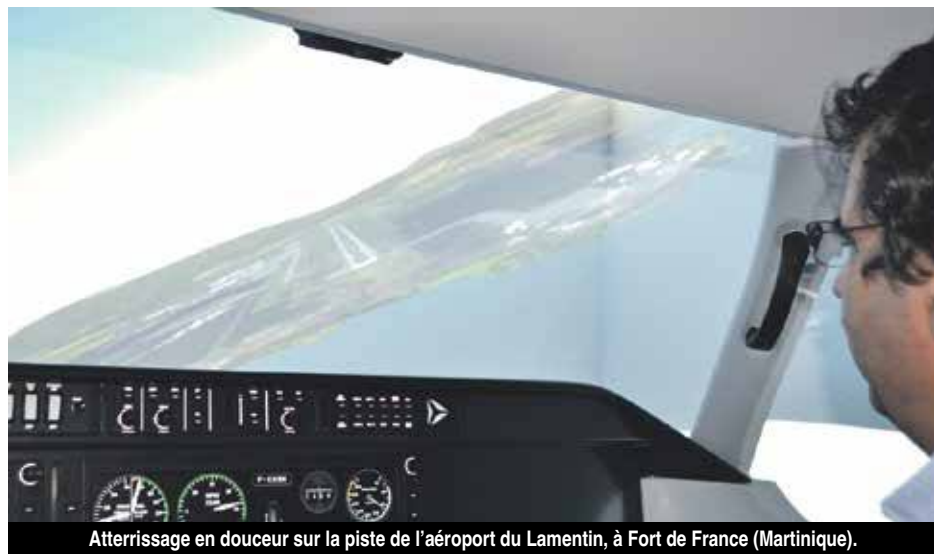
Atterrissage en douceur sur la piste de l'aéroport du Lamentin, à Fort de France (Martinique).

Car en effet, une heure dans le simulateur équivaut à environ 2 heures de vol, et la pédagogie est toute autre : le simulateur permet de faire des « arrêts sur image », alors que quand on vole, cela n'est pas possible », continue-t-il. Le simulateur offre d'importantes possibilités de conditions météorologiques, la pluie, la neige, le brouillard... Tous types de pannes en vol peuvent être simulés, permettant ainsi aux élèves d'appréhender exactement la conduite à tenir pour chacune de ces pannes. Le simulateur reproduit exactement à l'identique le poste de pilotage d'un avion bimo-