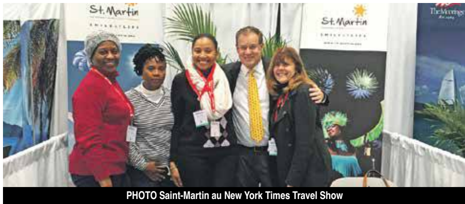
PHOTO Saint-Martin au New York Times Travel Show

Le Travel & Adventure Shows, série de salons américains qui se déroulent entre janvier et mars, est un incontournable pour l'Office de tourisme qui aura couvert cette année sept des huit éditions de l'événement, en plus du New York Times Travel Show.