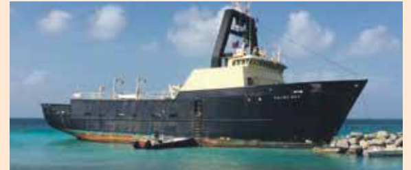
Après plusieurs tentatives vaines, le Yacht Hop échoué à la Baie Nettlé devrait être délogé dans les prochains jours.

Après plusieurs tentatives menées sans succès pour dégager le Yacht Hop échoué depuis près d'un mois sur des rochers à la Baie Nettlé, le navire devrait être délogé dans les prochains jours.