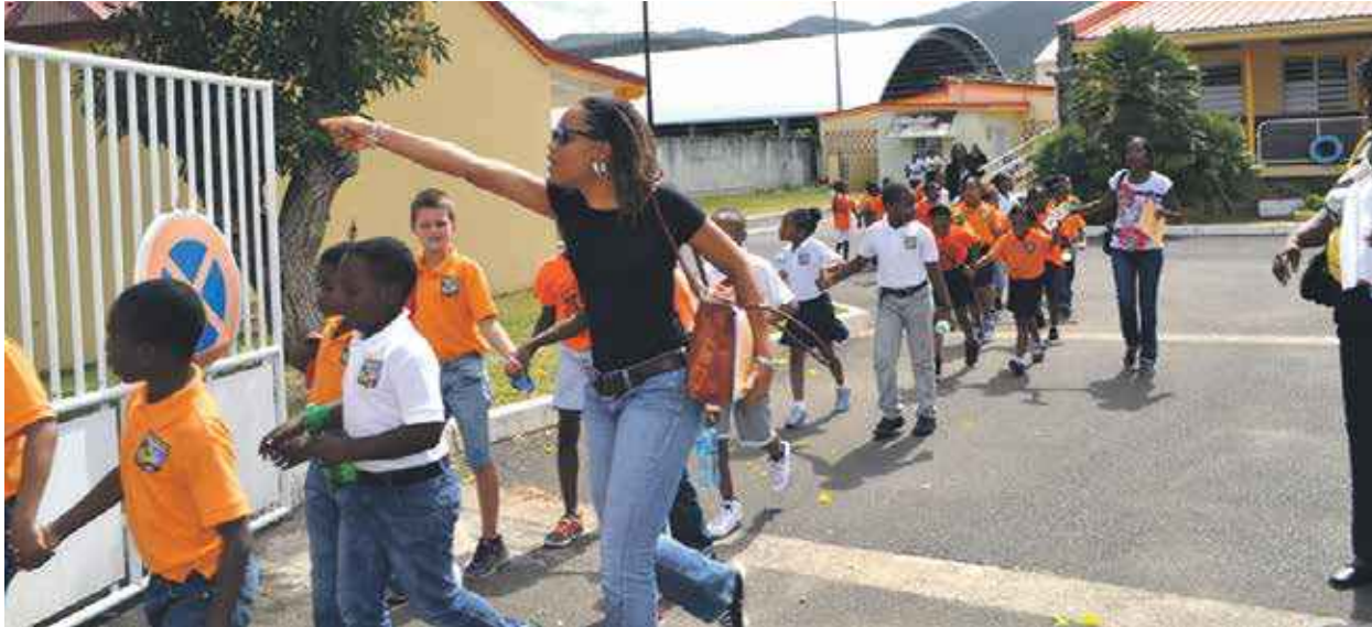
Dans le cadre de l'exercice Richter, mardi matin, l'école Nina Duverly a été évacuée. Les enfants et l'ensemble du personnel ont été acheminés par quatre policiers territoriaux vers un abri situé à Concordia.

Toute la semaine, la population de Saint-Martin a pu constater une activité des forces de l'ordre « anormale » sur l'île. C'est l'exercice Richter qui a eu cours toute la semaine, afin de tester les moyens réactionnels en cas de catastrophe naturelle.