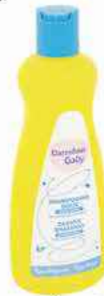
Shampooing doux sans savon Carrefour 250ml