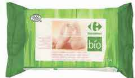
Lingettes bébé sans parfum Carrefour bio x64