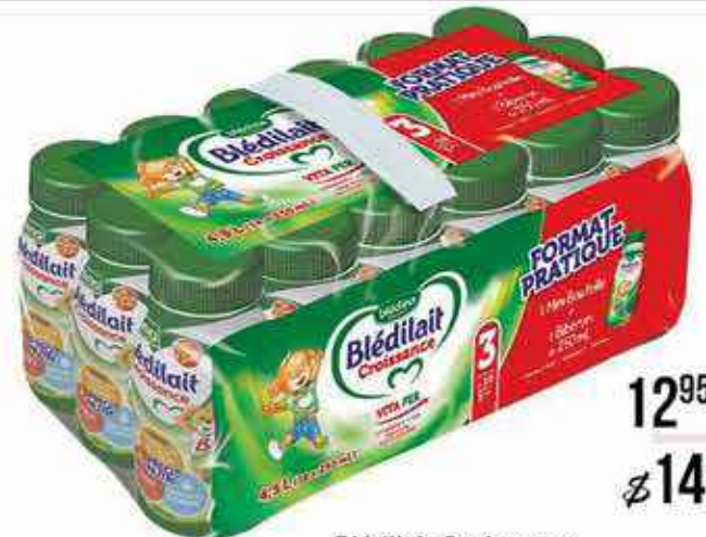
Blédilait Croissance 18 x250ml = 4,5l