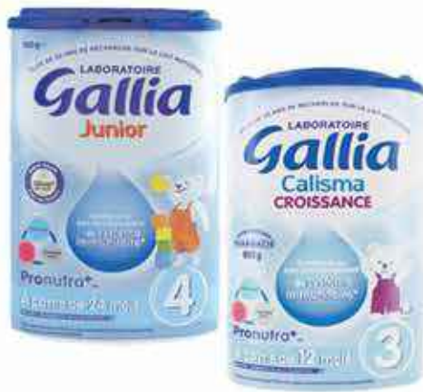
Gallia Lait Croissance ou Junior 900g