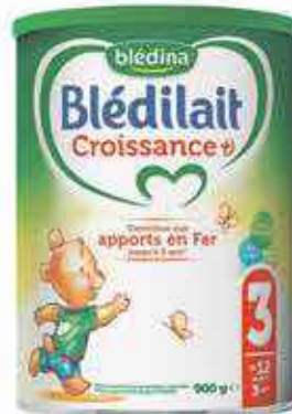
Blédilait Croissance 900g