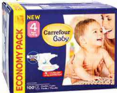
Changes Carrefour Midi 4-9kg 112pc Maxi+ 9-20kg 96pc Maxi 7-18kg 100pc Junior 11-25kg 88pc