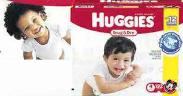
Huggies Snug & Dry T1 4-6kg 148 pc T2 6-9kg 140pc T3 7-13kg 132 pc T5t+12kg 96