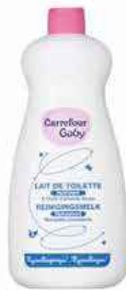
Lait de toilette hydratant peaux sensibles Carrefour 250ml