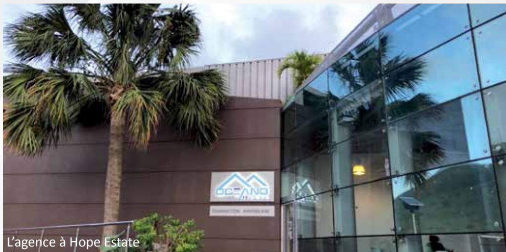
L'agence à Hope Estate