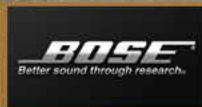
BOSE Better sound through research.