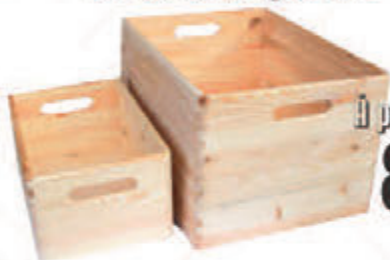
Bacs de Rangement