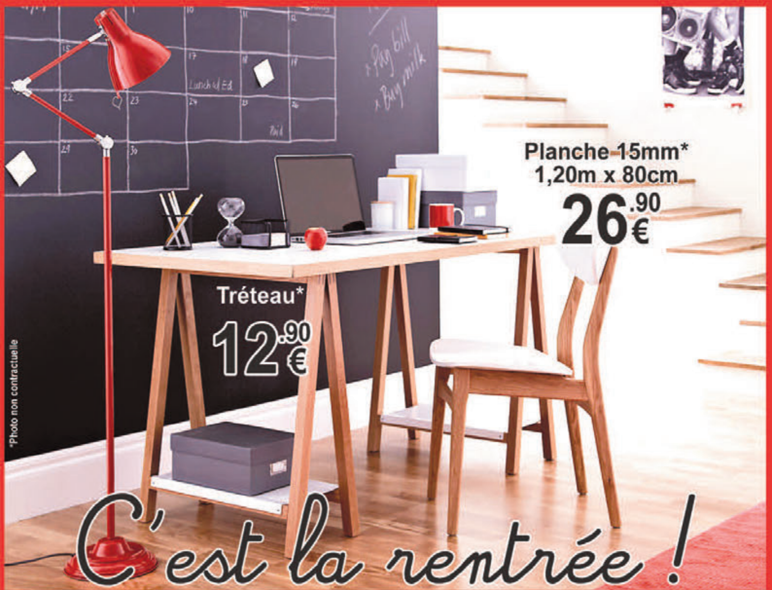
Planche 15mm* 1,20m x 80cm