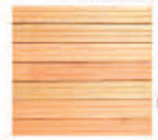
Caillebotis Pin Premium Vis Inox