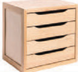
Blocs 3 ou 4 tiroirs