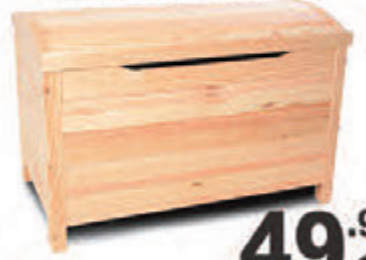
Coffre en Bois