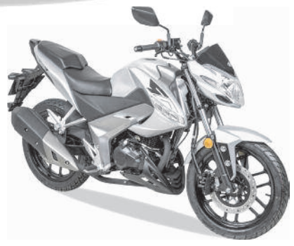
MOTO VISAR 125