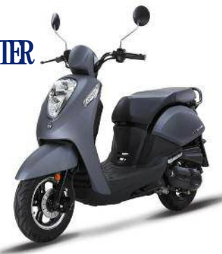
SCOOTER New MO 50i

70 route de Sandy Ground - 97150 Saint-Martin • 0690 77 01 42 • alain.schiestel@wanadoo.fr