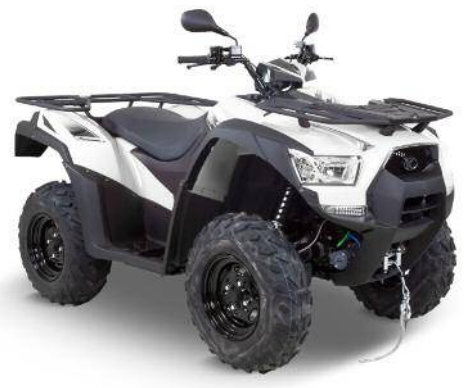
QUAD MKU 550