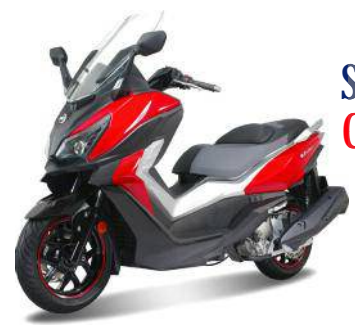
SCOOTER CRUISYM 125