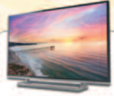
40" SAMSUNG SMART TV

Pour l'achat de tout autre modèle, recevez un cadeau au choix: