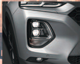
LED Fog Lights