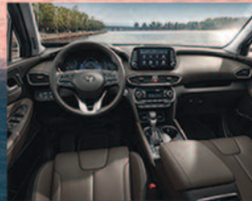
Stunning New Interior for 7 Passengers