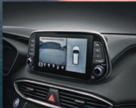
360 Degree Cameras