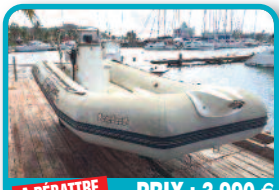
A DÉBATTRE PRIX : 3.990 €

ZODIAC BOMBARD EXPLORER 525 : 2001 Moteur : Suzuki 50 ch injection 4 temps totalisant 220 h Etat correct sauf flotteurs. Les flotteurs sont à recoller mais ne sont pas endommagés. Tél : 06 90 47 24 85