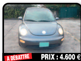
A DÉBATTRE PRIX : 4.600 €

BELLE AFFAIRE VW NEW BEETLE 2004 : manuelle, 119 000 Miles/191 511Km. Très bon moteur.