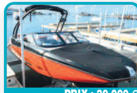
PRIX : 30.000 €

TECHNOMARINE 42 PIEDS : 2 moteurs Diesel 6V92 Detroit, antifouling refait, intérieur refait, cabine avant lit double, grand carré avec frigo, 2 feux, évier, frigo... Tél : 06 90 46 88 41