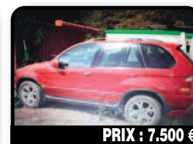
PRIX : 7.500 €

BMW X5 - 2005 : A débattre, visible sur Quartier d'Orléans Plaques hollandaises.