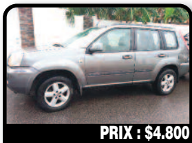
PRIX : $4.800

DODGE DAKOTA 2002 : En très bon état. no problem. Tél : 06 90 66 08 87