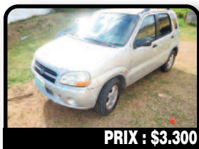
PRIX : $3.300

JEEP LIBERTY : Cause double emploi, je vends avec un certain regret ma Jeep Liberty, visible à la Baie Orientale. Immatriculée côté hollandais, CT OK. Essence, 152 kilomètres, Auto. Tél : 06 90 51 20 43