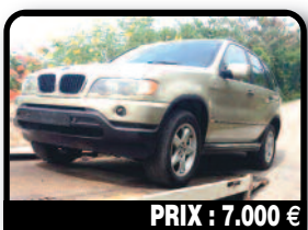
PRIX : 7.000 €

BMW X5 GOLD : good condition, new tires and battery!. Année 2001, 45623 kilomètres, Auto.