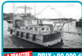
A DÉBATTRE PRIX : 90.000 €

NAVIRE DE PECHE : Navire français armé à la pêche côtière, refonte totale en 2009. Baisse de prix significative ! Navire en excellent état. Permis de navigation valide. Moteur Diesel D7 Volvo Penta 265 CV. Tél : 06 90 82 44 11