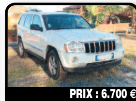
PRIX : 6.700 €

JEEP GRAND CHEROKEE : Vlimited année 2005, toit ouvrant, 98 400 km, bon état, contrôle technique OK.