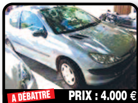
A DÉBATTRE PRIX : 4.000 €

PEUGEOT 307 : En très bon état. Contrôle technique ok. Nous la vendons pour cause de double emploi. Année 2005, Essence, 121800 kilomètres, Manuelle. Tél : 06 90 10 80 62