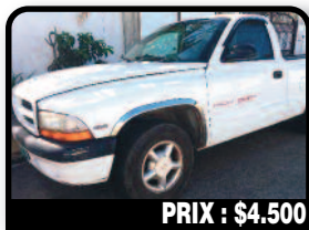
PRIX : $4.500

PEUGEOT 206 HDI : HDI climatisé - Année 2003 - Première main. Kilométrage 92000 kms. CT OK. Tél : 06 90 63 31 61