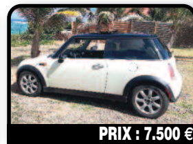
PRIX : 7.500 €

MINI COOPER : 2007 Essence 1ere main Très bon état 22000 miles donc TRÈS PEU DE KMS ! Boîte automatique Intérieur cuir Toit ouvrant Poste radio PIONEER Feux xénon HID Pas de frais à prévoir Affaire à saisir !