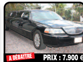
A DÉBATTRE PRIX : 7.900 €

LIMOUSINE LINCOLN : Lincoln Towncar Limousine by Crystal. 8 passagers, très bon état, entièrement opérationnelle. Immatriculée coté Français en VL. Année 2005, Essence, 110000 kms, Auto.