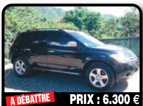
A DÉBATTRE PRIX : 6.300 €

NISSAN MURANO : noir 2005 bon état, bien entretenu factures à l'appui. Année 2005, Essence, 120000 kilomètres, Auto.