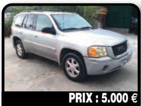
PRIX : 5.000 €

GMC ENVOY 4X4 : 68000 Miles. CT OK. Bon état général. Fonctionne très bien. Carrosserie bosselée. pas de rouille. Frais récents. Train avant, freins, direction, etc. Toutes options 4 roues motrices.