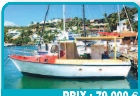
PRIX : 79.000 €

SUNSEEKER 48FT SUPERHAWK : 2 x 330 Yanmar. (less than 500 hours) one engine needs work. Generator. Great for cruising the Islands or start organizing charters and make some money. The location of the boat is perfect. Tél : 001 721 520 1231