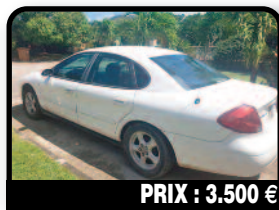
PRIX : 3.500 €

KIA RIO : 2006, 125 000km. en bon état. Elle roule tous les jours, très économique en carburant. Contrôle technique Ok jusqu'en août 2018. Changement de batterie à prévoir. Visible à Mont Vernon. Tél : 06 66 49 09 72