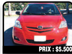
PRIX : $5.500

2006 TOYOTA YARIS : A picture is worth a thousand words. What you see is what you get. This beauty is in excellent condition. Clean in and out, it has AC, No scratches are on the Paint!.