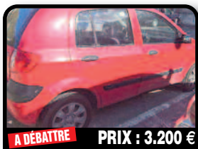
A DÉBATTRE PRIX : 3.200 €

SUZUKI IGNIS : Silver Color. Wonderful little car low mileage 68335 kilometers Everything works engine in great condition. 4 New Tires Selling need a bigger car for my family. Year 2005, Gasoline, 68335 kilometers, Manual. Tél : 06 90 81 88 63