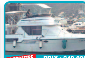
A DÉBATTRE PRIX : $49.000

JET BOAT SCARAB : 2016 toutes options. 8 Heures de navigation, comme neuf avec remorque et taud de Cockpit. Immatriculé, carte de navigation long 5.73m. larg. 2.43m. Tél : 06 90 73 16 71