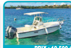
PRIX : 19.500 €

BATEAU : Je vends mon clear water bon état 20 pieds Ave son chariot excellent bateau pour la pêche ski nautique balades etc. Tél : 06 96 21 03 15