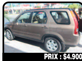
PRIX : $4.900

JEEP WRANGLER 2005 : Entièrement révisée. Pièces neuves : Radiateur, pompe à eau, batterie. A prévoir: 2 pneus avant et fenêtres plastiques. Année 2005, Essence, 75000 kilomètres, Auto. Tél : 06 90 40 87 42