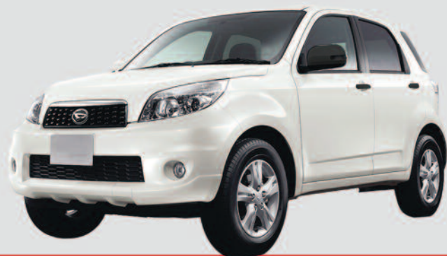
DAIHATSU TERIOS 2012 - 35 897 miles $12,500