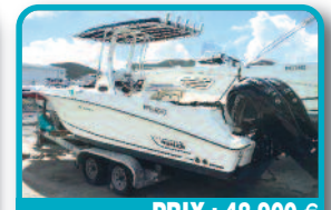
PRIX : 48.900 €

CARVER 325 : (mini cruiser) en tres bonne condition. Habitable a l'annee, tres spacieux, cuisine complete, peut coucher 4 personne, double air climatisé, écran plat, frigo américain, idéal pour longue vacance ou pour faire du Island hopping. Tél : 001 721 581 3242