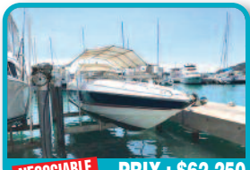
NEGOCIABLE PRIX : $62.250

BOSTON WAHLER : Vend bateaux Boston wahlér 220 outrage avec deux moteurs Mercury dernière génération, récent et toujours entretenu. Tél : 06 90 59 42 84