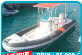
A DÉBATTRE PRIX : 25.000 €

PETIT BATEAU EN FIBRE DE VERRE + MOTEUR : Bateau en fibre de verre de 5 mètres avec 30 cv Yamaha + remorque + 2 nourrices et matériels divers. Longueur 5 mètres. Tél : 06 90 22 25 99