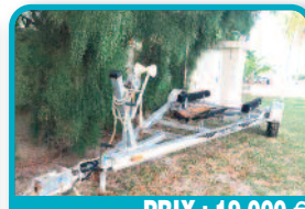
PRIX : 19.000 €

BATEAU PÊCHE PROMENADE AVEC CABINE : Fish Hawk Celebrity 210 Cabine W.end 2 couchages + coussins intérieur et extérieur 2 X 85 ch Yamaha (2 temps) 155 heures TBE Sondeur graphique + GPS + VHF + spot 2 batteries... Tél : 06 90 66 40 80