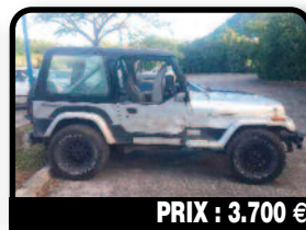
PRIX : 3.700 €

FORD TAURUS : urgent LEAVING ISLAND Year : 2003 Essence, Auto. Tél : 06 90 23 02 25