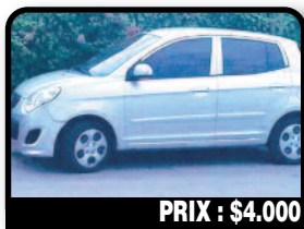
PRIX : $4.000

JEEP WRANGLER 1991 : A vendre jeep wrangler, 75. 000km, moteur tourne impeccable. quelques details esthetique a refaire mais rien d'urgent. Voiture ideal pour ici !! Tél : 06 90 58 81 02