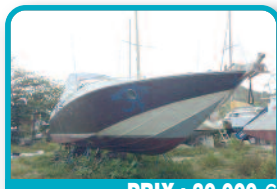
PRIX : 30.000 €

JET BOAT SCARAB 195 IMPULSE 2016 : couleur : Sunburst orange, Full option (sound system, trim, bimini...), Longueur 6m, 8 places assises, 250 chevaux, Neuf (Environ 8 heures de navigation) Tél : 06 90 77 07 32