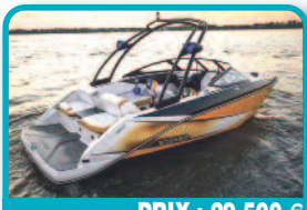
PRIX : 29.500 €

SEMI RIGIDE 21' FLEXBOAT : 2011 Protection neuve complète des boudins hypalon Bimini fixe complet neuf Direction hydraulique "sea star" neuve Moteur 150 CV EVINRUDE Etec 180h. Tél : 06 90 64 73 73