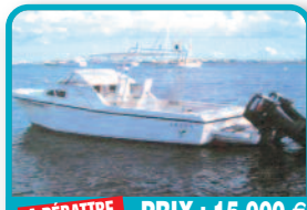
A DÉBATTRE PRIX : 15.000 €

20FT WELLCRAFT : 20 Ft Wellcraft with 150hp Johnson engine and trailer. Serious inquiries. Tél : 001 721 581 5000