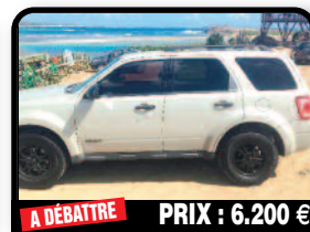
A DÉBATTRE PRIX : 6.200 €

FORD ESCAPE : Estimée 7000€ mais clim à réparer et jauge d'essence soit environ 600€ de réparations à prévoir. Parfait état général, remise quasi à neuf il y a 1 mois, factures à l'appui.