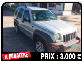
A DÉBATTRE PRIX : 3.000 €

JEEP LIBERTY : Cause double emploi, je vends avec un certain regret ma Jeep Liberty, visible à la Baie Orientale. Immatriculée côté hollandais, CT OK. Essence, 152 kilomètres, Auto. Tél : 06 90 51 20 43