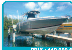
PRIX : 110.000 €

TRAWLER EUROBANKER 38 : 1979 refit 2012, coque polyester - teck deck & intérieur - 2 cabines - cuisine US Immatriculé PP - tax paid - visible à Saint Martin Année 2012, Longueur 10 mètres. Tél : 06 90 21 98 20