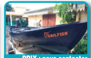
PRIX : nous contacter

MAKO 23 SPORT : bon état général avec 2 Moteurs Yamaha 115 Hp 650 heures (2006), Guindeau Electrique, Sondeur traceur GPS Raymarine 700, Porte-cannes, Remorque 2-essieux, Révisé, antifouling neuf. Tél : 06 90 50 08 55