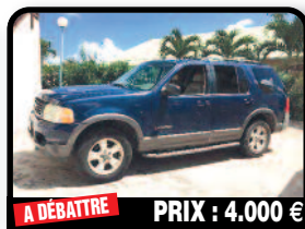
A DÉBATTRE PRIX : 4.000 €

FORD EXPEDITION 8 PLACES : en bon état. Année 1999, Essence, 225308 kilomètres, Auto. Tél : 06 90 58 27 71