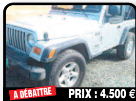
A DÉBATTRE PRIX : 4.500 €

HONDA CR-V : Année 2005, Essence, Auto. Tél : 06 90 48 35 38