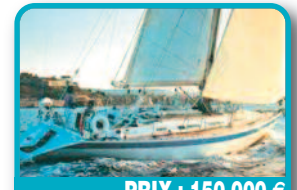
PRIX : 150.000 €

WAUQUIEZ CENTURION 49 : 1995 refait entièrement 2009 -3 cabines -2 salles de bain -2wc Très beau bateau mythique du chantier Wauquiez. Moteur YANMAR 80 DIESEL (2009). Tél : 06 90 61 68 40