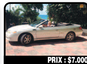
PRIX : $7.000

TOTOYA SOLARA : good condition and parts included. Année 2002, 92152 kilomètres, Auto.