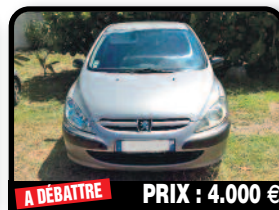
A DÉBATTRE PRIX : 4.000 €

FORD EXPLORER : Année 2004 103000 km Sans contrôle technique Quelques travaux à prévoir. Année 2004, Essence, 103000 kilomètres, Auto. Tél : 06 90 22 65 78