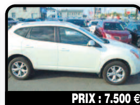
PRIX : 7.500 €

NISSAN ROGUE AWD : Bon état général révision faite, 4 pneu neuf, vitesse automatique avec palette au volant. Sono bose, phare xénon, 4/4 permanent. Très bonne occasion. Disponible mi avril.