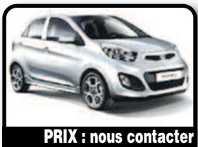
PRIX : nous contacter

KIA PICANTO : 2 ans à vendre en formule location / vente. Plus info contact Philippe. Année 2015, Essence, Auto.