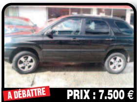
A DÉBATTRE PRIX : 7.500 €

KIA SPORTAGE : année 2010, tres bonne etat, 33000 km bien entretenu.