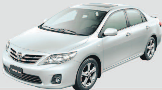
TOYOTA COROLLA 2012 - 38 619 miles $12,500