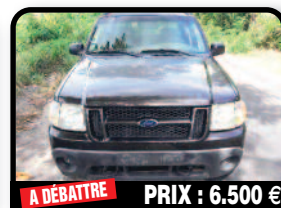
A DÉBATTRE PRIX : 6.500 €

FORD EXPLORER PICK-UP : xlt sport trac de 2005. Pick up de 112000km. Intérieur cuir et toutes options. Disponible fin mars. Année 2005, Essence, 112000 kilomètres, Auto.