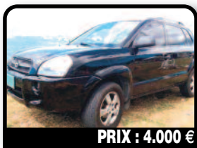
PRIX : 4.000 €

JEEP GRAND CHEROKEE : bon état général intérieur cuir. Année 2005, Essence, Auto. Tél : 06 90 33 33 03