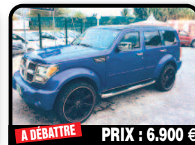
A DÉBATTRE PRIX : 6.900 €

DODGE NITRO 2007 : V6 4x4 à vendre en l'état. Modele US, importé Nov 2011 avec 77000 miles. Ecran tactile, DVD, MP3, Jantes Noire 22" Rodolphe. Année 2007, Essence, 183465 kms, Auto.