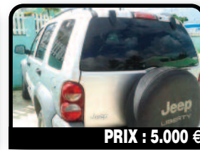
PRIX : 5.000 €

JEEP LIBERTY : urgent particulier vend cause départ jeep liberty couleur grise bon état g'ÉnÉral. contrôle technique ok. Année 2006, Essence, 85295 kilomètres, Auto.