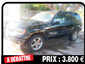
A DÉBATTRE PRIX : 3.800 €

2011 KIA PICANTO : Standard. Tél : 06 90 49 89 72