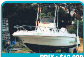
PRIX : $10.000

ZODIAC BOMBARD EXPLORER 525 : 2001 Moteur : Suzuki 50 ch injection 4 temps totalisant 220 h Etat correct sauf flotteurs. Les flotteurs sont à recoller mais ne sont pas endommagés. Tél : 06 90 47 24 85