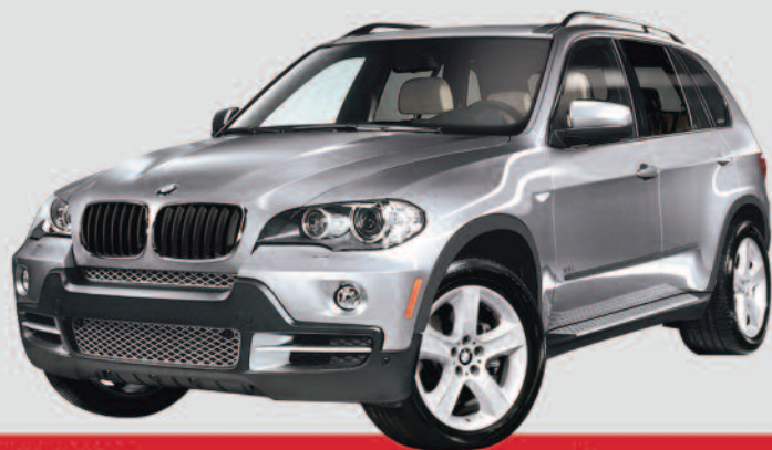
BMW X5 2009 - 38 938 miles $18,800

Nous avons d'autres modèles de véhicules à la vente.