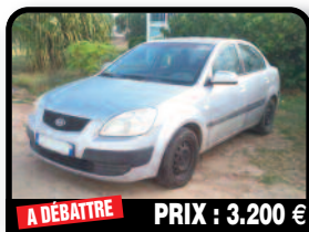
A DÉBATTRE PRIX : 3.200 €

HYUNDAI GETZ : Technique tjrs entretenue. Year 2009, Gasoline, 107000 kilometers, Auto. Tél : 06 90 66 22 86