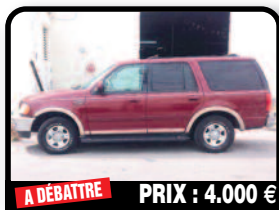
A DÉBATTRE PRIX : 4.000 €

HYUNDAI TUCSON : Année 2006. 120000 km. Très bon état intérieur/extérieur 2 clés 2 pneus presque neufs. Nombreux frais. Aspirateur à voiture compris. Tél : 06 90 27 80 38