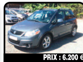
PRIX : 6.200 €

SUZUKI SX4 AWD : superbe état - 1 seul propriétaire - tres bas kilométrage - le contrôle technique est OK. Année 2008, Essence, 20000 kilomètres, Auto.