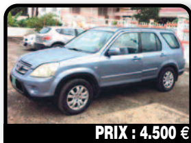
PRIX : 4.500 €

NISSAN X-TRAIL : nissan xtrail 2006. Tél : 06 90 66 08 87