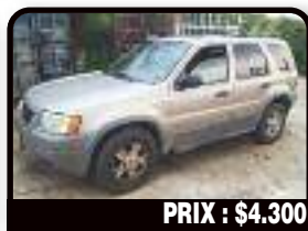
PRIX : $4.300

GRAND CHEROKEE : Vends cause double emploi. 1996 entièrement Balckstone. Grande capacité de Chargement. Interieur impeccable. Pas de frais à prévoir. Passe partout. CT ok. Essence, 123919 kms. Tél : 06 90 27 39 31