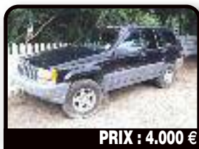
PRIX : 4.000 €

RAV4 : en excellent état, 118000km, 1998. Tél : 06 90 66 12 83