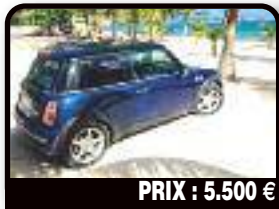
PRIX : 5.500 €

GETZ DIESEL : Ct ok. Diesel, Manuelle. Tél : 06 90 88 10 88