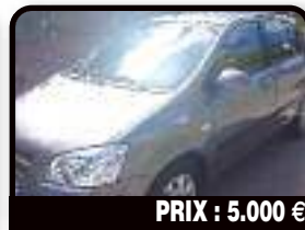
PRIX : 5.000 €

CHEVROLET SUBURBAN V8 : Chevrolet suburban V8. Année 1985, Essence, Auto. Tél : 001 721 554 5084