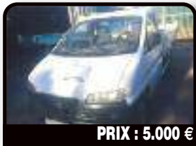
PRIX : 5.000 €

MUSTANG GT 2003 : Vends GT 4. 6 l. Bon état CT OK 08/2017. Année 2003, Essence. Tél : 06 90 39 94 00