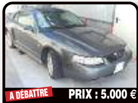
A DÉBATTRE PRIX : 5.000 €

MINI ONE : 2005 - CT FRANCAIS OK. Roule tous les jours. Entretien tout au long de l'année. Vente cause double emploi. Plaques Françaises. Visite possible. Aucun frais à prévoir. Tél : 06 90 75 38 37