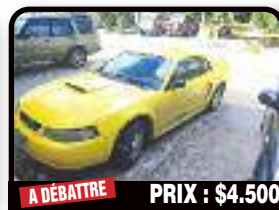
A DÉBATTRE PRIX : $4.500

FORD ESCAPE : ct ok until april 2018 perfect driving conditions and no future repairs. Year 2001, Diesel, 92000 kilometers, Auto. Tél : 06 90 77 97 03