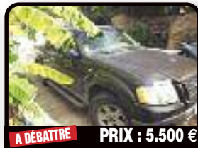
A DÉBATTRE PRIX : 5.500 €

JEEP LIBERTY RENAGADE : Voiture à vendre. Bon état. Egatignures mineures. Intérieur propre. Quatre roue motrices. Year 2003, Gasoline, Auto. Tél : 06 90 13 72 45