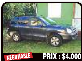
NEGOTIABLE PRIX : $4.000

HYUNDAI SANTA FE 2005 : Blue Hyundai Santa fe for sale. Drives smoothly only the air-condition does not work. But this is def fixable. Year 2005, Gasoline, 83757 kilometers, Auto. Tél : 001 721 581 7870