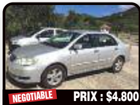
NEGOTIABLE PRIX : $4.800

KIA SORENTO FROM 2005 : I'm selling mij car because I'm leaving the island. With exception of the AC which isn't working, the car is in great condition. Year 2005, Gasoline, Auto. Tél : 001 721 526 4313