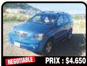
NEGOTIABLE PRIX : $4.650

KIA PICANTO : for sale kia Picanto, new tire, new brake pad, new water pipe CT 4 month ago the front Window have a rift. leaving the Island. Year 2010, Gasoline, 64000 kilometers, Auto. Tél : 06 90 22 41 00