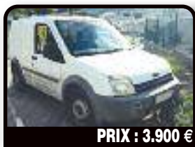
PRIX : 3.900 €

HYUNDAI SANTA FE 2005 : Blue Hyundai Santa fe for sale. Drives smoothly only the air-condition does not work. But this is def fixable. Year 2005, Gasoline, 83757 kilometers, Auto. Tél : 001 721 581 7870