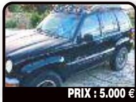
PRIX : 5.000 €

CAMION BENNE : vends camion benne H1 année 2003 CT OK. Tél : 06 90 61 99 97