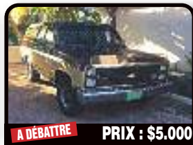
A DÉBATTRE PRIX : $5.000

TOYOTA COROLLA : it runs very well, just serviced, many parts changed, new muffler, tires, shocks, brakes, timing belt. 2007, Gasoline, 120000 kms, Auto. Tél : 001 721 586 8411