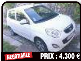
NEGOTIABLE PRIX : 4.300 €

2006 CHEVROLET EQUINOX : Drives great, aircondition great, small rust spot to the back. Tél : 001 721 584 0593