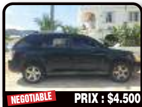
NEGOTIABLE PRIX : $4.500

FORD MUSTANG 2003 : moteur refait parfaite conditions v6 318 urgent cause départ le 30 novembre. Essence, 70000 kilomètres, Auto. Tél : 06 90 61 08 97