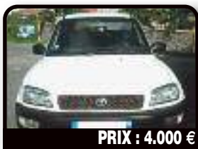
PRIX : 4.000 €

UTILITAIRE FORD TRANSIT CONNECT : ford Transit Connect TDCI - 110 ch 1ère main. Année 2009, Diesel, 180000 kilomètres, Manuelle. Tél : 06 90 71 47 11