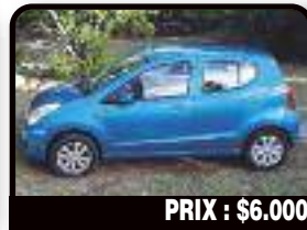
PRIX : $6.000

FORD PICK UP EXPLORER XLT : siège cuir, vitre donnant sur plateau électrique, bon état, contrôle fait et réparations faites, (bielles et essuie glace.) Libre fin janvier 2017. Année 2005, Essence, 110000 kilomètres, Auto. @ : goubaud.valerie@yahoo.fr