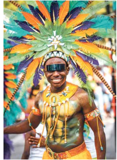
selon la tradition par le « Burning Of Moomoo » à Marigot. A.B

Les festivités se poursuivront lundi avec le « We Showdown » à Galisbay puis le mardi 21 février avec la grande parade de mardi gras, en costumes. Des costumes que le public découvrira à la toute dernière minute, car s'il est un secret bien gardé, c'est bien celui des tenues. Et cette année, impossible de se faire une idée, car il n'y a pas de thème imposé, la surprise sera donc totale. Mercredi 22 février, le carnaval se clôturera