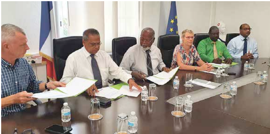
Signature d'une convention entre la Collectivité, la CAF et la CGSS, par les présidents et directeurs des deux organismes et du président de la Collectivité, assisté de sa directrice de délégation Solidarité et familles.

L'union fait la force ! C'est la devise que semble vouloir adopter la Collectivité afin d'atteindre ses priorités : améliorer le cadre de vie de ses administrés et ne laisser personne sur le côté de la route ; renforcer les politiques en faveur de la sécurité et la prévention de la délinquance.