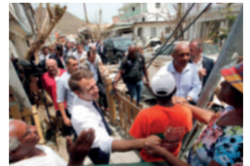
Le président Macron en visite à Saint-Martin le 12 septembre

été basés sur l'île de la Martinique pour prévoir des secours immédiatement après la catastrophe (...) ». Et d'ajouter : « Quand les prévisionnistes ont remonté la trajectoire d'Irma sur les Iles du Nord, nous avons déplacé ces hommes sur la Guadeloupe ». Et pourtant, ces 1100 hommes, les îles de Saint-Martin et de Saint-Barthélemy ne les ont pas vus fouler leur sol avant le lundi 11 septembre (à J+5), veille de l'arrivée du Président Macron à Saint-Martin... Le dimanche 3 septembre, un avion de la Navy parti en reconnaissance, confirme bien qu'un ouragan majeur est prévu de passer sur les Iles du Nord pour