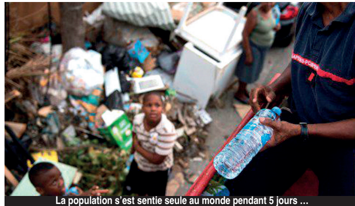
La population s'est sentie seule au monde pendant 5 jours ...

(source de la chronologie : page FB Olivier Tisserand)