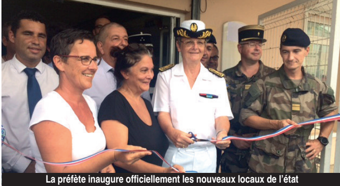
La préfète inaugure officiellement les nouveaux locaux de l'Etat

L'ouragan Irma n'a pas épargné les locaux de la Préfecture de Saint-Martin et Saint-Barthélemy situés sur la route du Fort Louis. Ses services se sont donc provisoirement installés dans les anciens locaux de Pôle Emploi, en face du collège du Mont des Accords, à Concordia. Des locaux inaugurés hier matin, en présence de l'ensemble des corps de l'Etat.