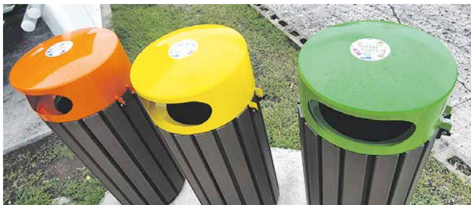
Photo de la semaine : Mode d'emploi sur les corbeilles urbaines de tri sélectif

Installées en décembre 2022 sur 130 sites du territoire, les corbeilles de tri sélectif, en mode triptyque, verte, jaune et orange, ne comportaient pas d'indication quant à leur mode d'emploi. Le code couleur n'étant pas encore complètement rentré dans les esprits, ce manquement a été souligné et la Collectivité a entrepris d'y remédier. Outre une campagne de communication réalisée sur les panneaux publi-