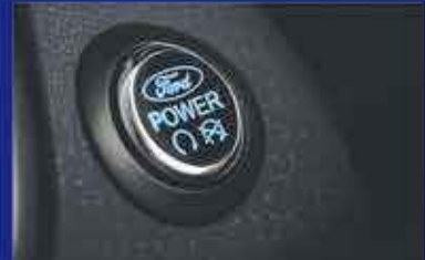
BOUTON DE DÉMARRAGE.

A partir de 17,990€! TTC* Après un apport de 15% (2698€) 59 mensualités de 337€ *Prix après remise. Frais d'immatriculation offerts. Calcul non contractuel hors assurances crédit.