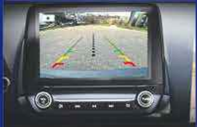
CAMÉRA DE REcul. APPLE CARPLAY/ANDROID AUTO.