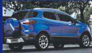
NOUVELLE MOTORISATION PUISSANTE.