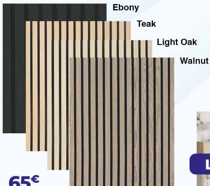
65€ Panneau Acoustic 2400*600*21mm