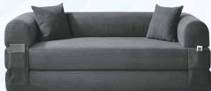
449€ Canapé Lit Houston 203 cm x 76 cm