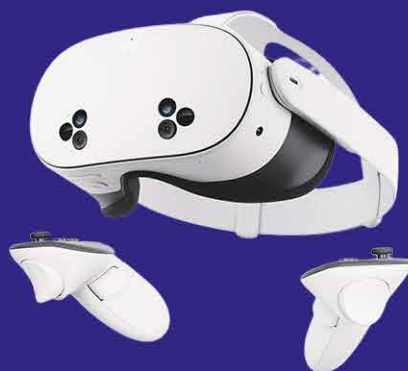
326€ Meta Quest 3S 128 Go Reconditionné Usine