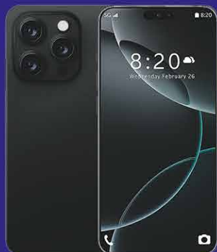
199€ G16 Pro Max 5G Unlocked Smartphone Android 15 6 +128GB Dual SIM