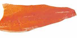
FILET DE TRUITE ARC EN CIEL D'ÉLEVAGE