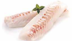
DOS DE CABILLAUD