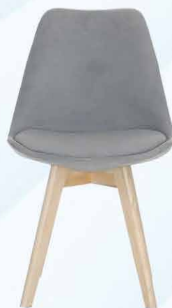
100€ Chaise EPICURE Lot de 2 style velours gris