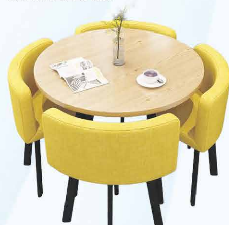
287€ 187€ Table ronde en bois et ses 4 chaises 90 cm de diamètre