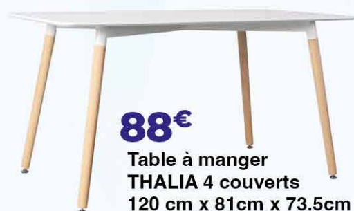
88€ Table à manger THALIA 4 couverts 120 cm x 81cm x 73.5cm