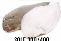
SOLE 300/400 OU 800/1000