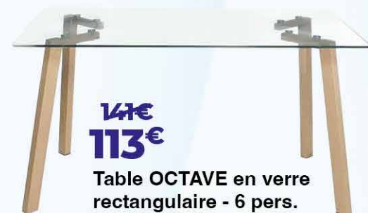
147€ 113€ Table OCTAVE en verre rectangulaire - 6 pers.