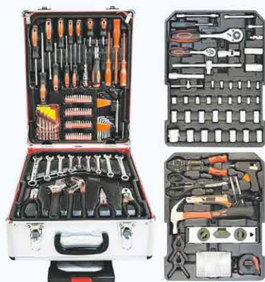
85€ Boîte à outils 599pcs