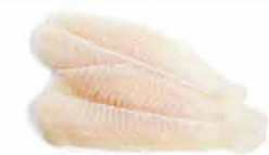
FILET DE TURBOT D'ÉLEVAGE