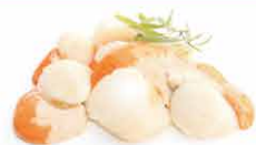
NOIX DE SAINT JACQUES