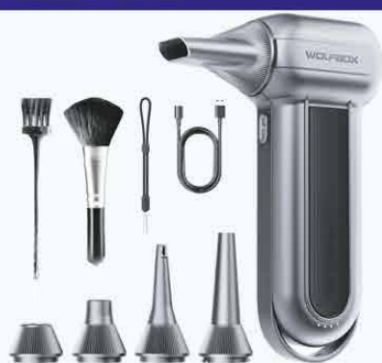
113€ Souffleur d'air électrique sans fil Puissance extrême 150 000 tr/min