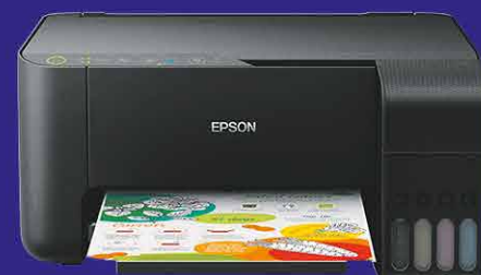
219€ 180€ Imprimante Epson Ecotank L3258 WiFi