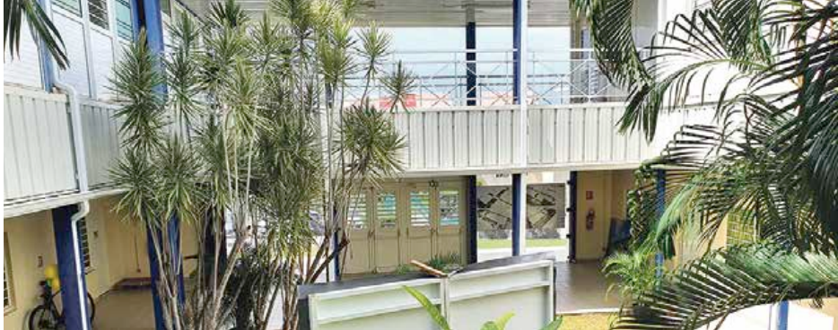
Cet espace actuellement appelé "le patio" deviendra l'accueil général de l'hôpital tel qu'il est conçu dans le projet d'extension.

L'Hôpital Louis Constant Fleming vient de fêter ses 20 ans. Une entrée dans sa vie mature qui a mis en exergue la nécessité de procéder à son extension ainsi qu'à une réorganisation cohérente et efficace de ses services, en optimisant sa résilience. Focus sur ce projet d'extension.