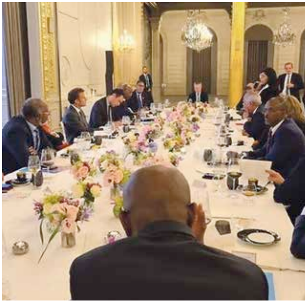
déjeuner de travail à l'Elysée le 7 septembre 2022 avec les élus ultramarins.

Appelées de leurs vœux par certains territoires ultramarins, dont Saint-Martin, les réformes institutionnelles semblent ne pas se profiler dans un avenir proche. Selon nos confrères de France Info, le Chef de l'Etat Emmanuel Macron, a indiqué souhaiter voir s'inscrire un consensus sur chacun de ces territoires avant la mise en œuvre de ces évolutions. Deux experts seront prochainement nommés et dépêchés dans les territoires pour proposer des projets de réforme.