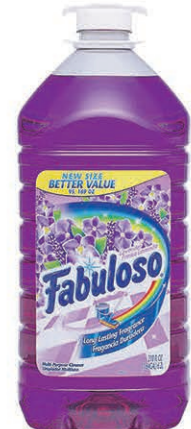
FABULOSO LAVANDE 6,21 litres $9 99