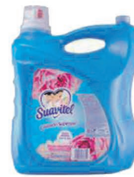
ADOUCISSANT SUAVITEL 8 litres $13