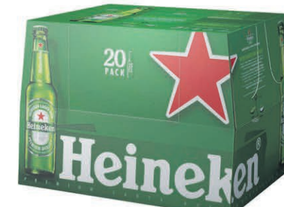
BIÈRES HEINEKEN 20 bouteilles de 25cl $11 99