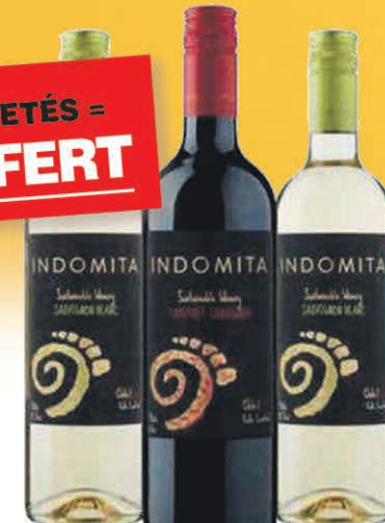
VINS INDOMITA 75 cl sur une sélection au choix