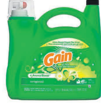
LESSIVE LIQUIDE GAIN 5,9 litres $23 99