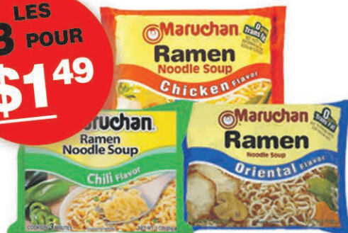
NOUILLES INSTANTANÉES RAMEN MANUCHAN 3x 85 gr sur une sélection au choix $1 49