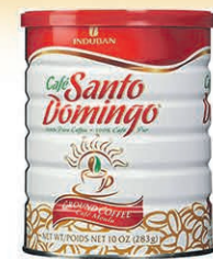
CAFÉ MOULU SANTO DOMINGO les 284gr $5 55