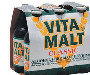
VITAMALT CLASSIC les 6 x 330ml $4 99