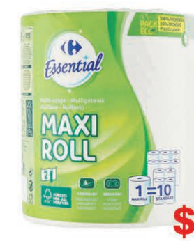
ESSUIE-TOUT MAXI ROLL CARREFOUR 1 rouleau de 450 feuilles $4 44