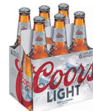
BIÈRES COORS LIGHT 6 bouteilles de 355ml $5 55