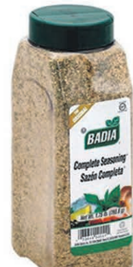
MÉLANGE D'ÉPICES BADIA les 795gr $6 66