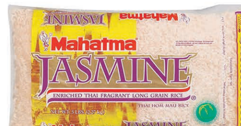
RIZ MAHATMA JASMINE les 2,27 kilos $5 99