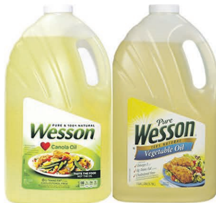
HUILE WESSON VÉGÉTALE OU COLZA les 4,74L $15 99