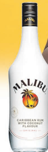
MALIBU 1 litre $9 99