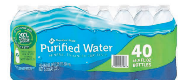
EAU MEMBERS MARK 40 bouteilles de 500ml $8 99