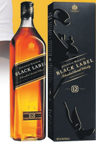
JOHNNIE WALKER BLACK LABEL 1 litre $25 99