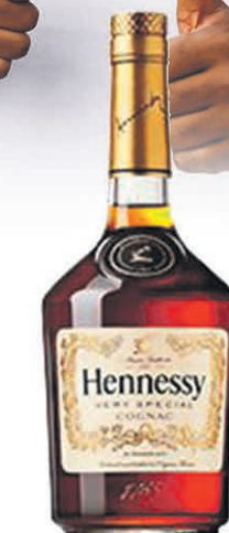
HENNESSY V.S. COGNAC 1 litre $49 99