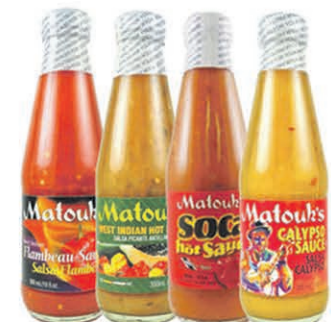
SAUCE PIQUANTE MATOUK'S 300ml sur une sélection au choix $1 99