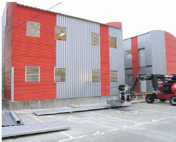
(photo d'archives 2019) Livrées neuves en 2019 afin de pallier le manque de salles de cours de la Cité scolaire Robert Weinum après l'intégration du collège Soualiga détruit par l'ouragan Irma en 2017, les classes mobiles présentent aujourd'hui des défaillances de sécurité.

remise en fonction de ces trois salles » et que « si les 3 salles du rez-de-chaussée ne suffisaient pas à assurer une reprise normale des cours, des propositions complémentaires seront faites à la communauté scolaire. La Collectivité a réaffirmé être « pleinement impliquée dans ce dossier et s'est engagée à tenir les parents informés des prochaines avancées ».