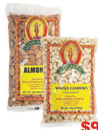
AMANDES ENTIÈRES/ CAJOU ENTIÈRES LAXMI les 800gr $9 99