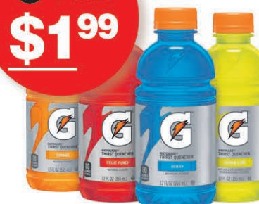
BOISSON ÉNERGISANTE GATORADE sur une sélection au choix