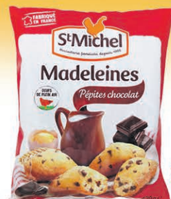
MADELEINES ST. MICHEL les 400gr/500gr sur une sélection au choix $4 44