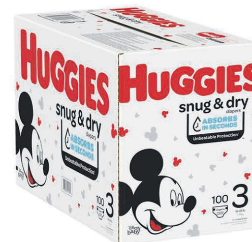
COUCHES HUGGIES 100 unités - Taille 1 à 6 $25