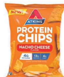
CHIPS PROTIEN ATKIN 31 gr sur une sélection au choix $2 50