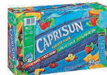
JUS CAPRISUN 4 x 10 gourdes $12 50