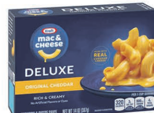
MAC & CHEESE DELUXE KRAFT les 396 gr sur une sélection au choix $2 77