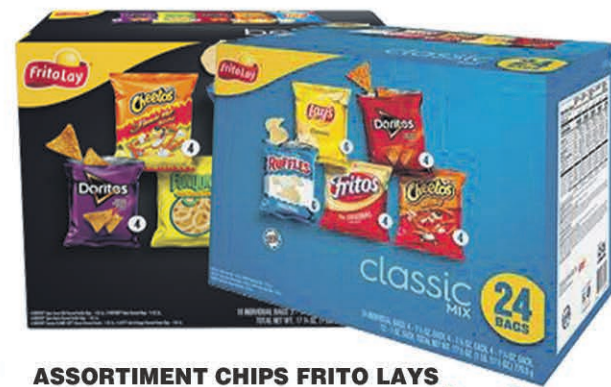
ASSORTIMENT CHIPS FRITO LAYS CLASSIQUE OU BLOD MIX 24 pièces $9 99