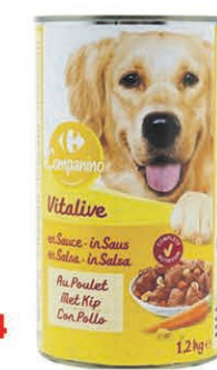
PÂTÉE POUR CHIEN CARREFOUR 1,25 kg $2 77