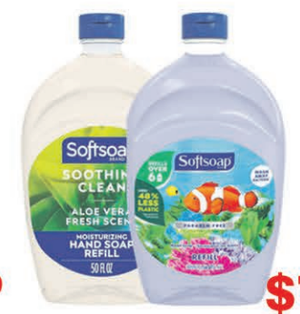
RECHARGE SAVON LIQUIDE SOFT SOAP 1,47 l sur une sélection au choix $7 50