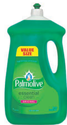
LIQUIDE VAISSELLE PALMOLIVE 3,01 litres $9 50