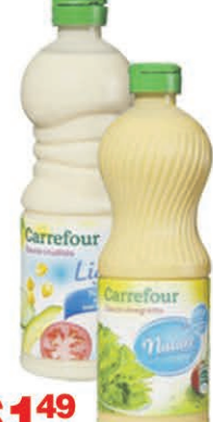
SAUCE VINAIGRETTE CARREFOUR 500 ml $1 49