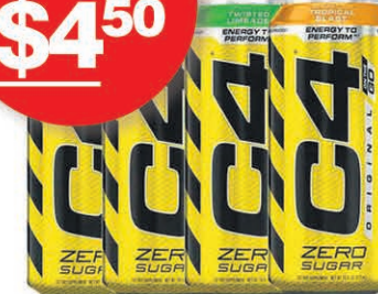
BOISSONS ÉNERGISANTES C4 sur une sélection au choix 474ml