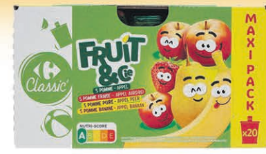
COMPOTES DE FRUITS CARREFOUR 20 gourdes $7 50