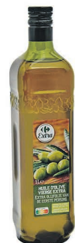
HUILE D'OLIVE EXTRA VIERGE CARREFOUR 1 litre $9 99