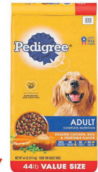
CROQUETTES POUR CHIEN ADULTE AU POULET PEDIGREE le sac de 20kg $46