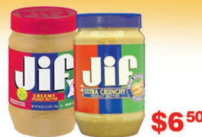
BEURRE DE CACAHUËTES JIF CREAMY/EXTRA CRUNCHY 1,36kg $6 50