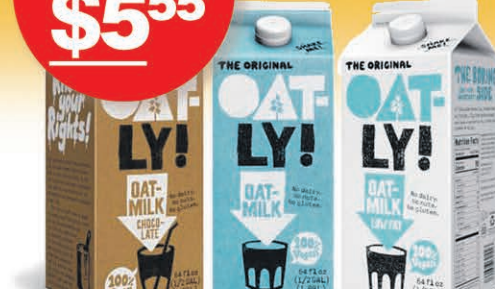
LAIT D'AVOINE NATURE, CHOCOLAT, ALLÉGÉ OATLY SUR UNE SÉLECTION AU CHOIX 1 litre