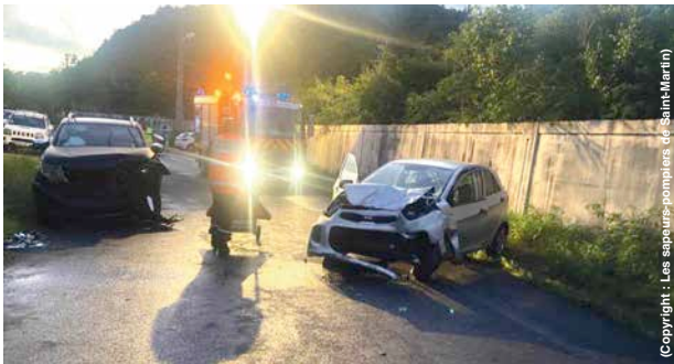
Image d'archive de l'accident du 23 janvier 2023