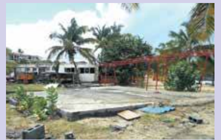
Photos avant après

Mardi dernier, sur instruction du parquet et après constat des services d'urbanisme de la collectivité et enquête de gendarmerie, un double container installé illicitement sur la plage de Friar's Bay a été enlevé, avec le concours de la collectivité et de la gendarmerie. Le propriétaire, un restaurateur qui entendait installer une boutique mais n'avait fait aucune demande de permis de construire, est convoqué en justice pour le 8 juin prochain. Il déclare vouloir se mettre en conformité.