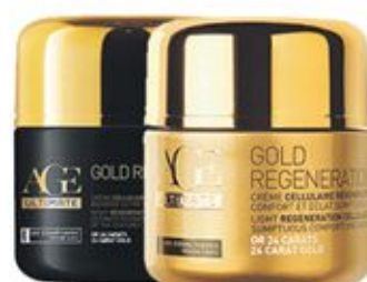
Crème cellulaire régénération Jour ou nuit Gold Regeneration 50ml