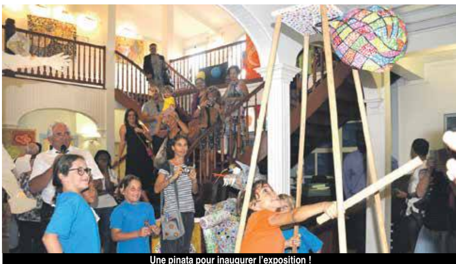
Une pinata pour inaugurer l'exposition !