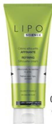
Crème silhouette Affinante 200ml