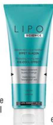
Sérum réducteur tonifiant effet glaçon 200ml