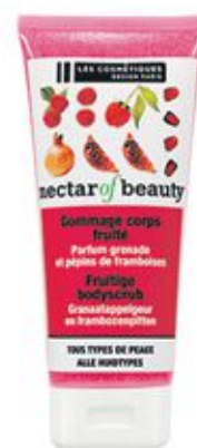
Gommage corps Les Cosmétiques Grenade Framboise 200ml