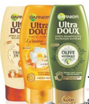
Ultra Doux Après Shampooing multiples variétés 200ml