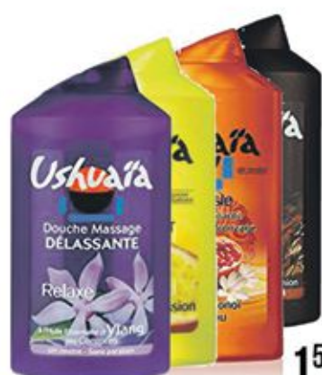
Gel douche Ushuaïa multiple variétés 250ml