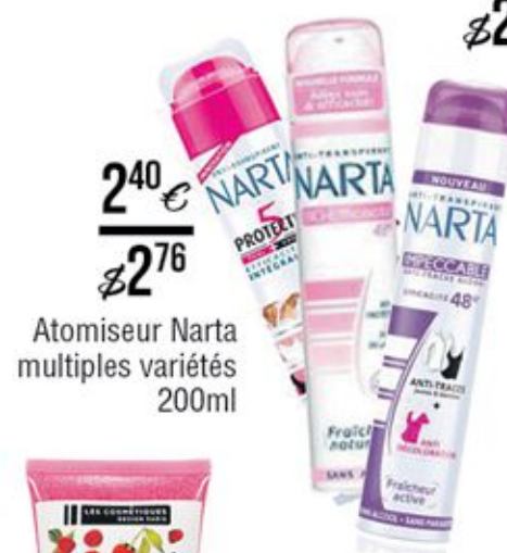
Atomiseur Narta multiples variétés 200ml