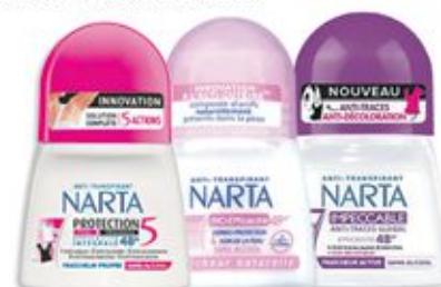
Roll On Narta multiples variétés 50ml