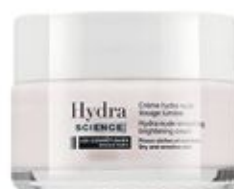
Crème Luministe hydra-nude lissage lumière peaux normales à mixtes ou peaux sèches et sensibles 50ml