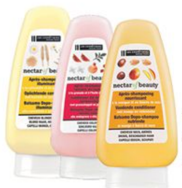
Après Shampooing Mangue-Karité / Amande- Fleur d'Oranger / Camomille-Blé / Grenades- Jojoba / Avocat-Karité 200ml