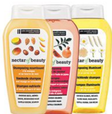
Shampooing Mangue-Beurre de Noix / Camomille-Blé / Grenades-Jojoba / Avocat-Karité 250ml