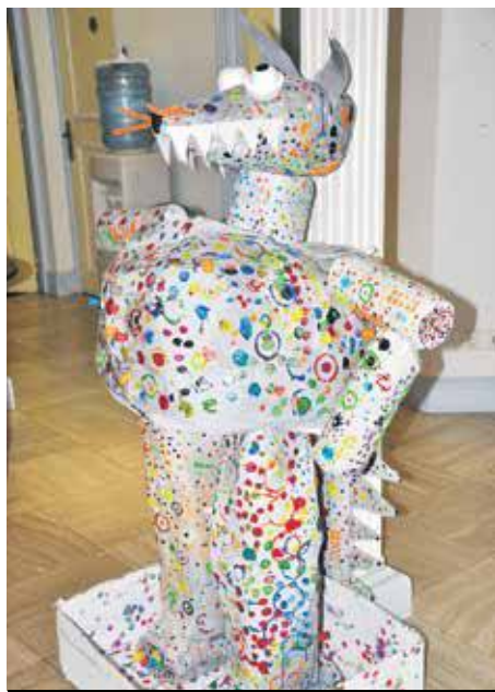
Un chien qui a attrapé la varicelle