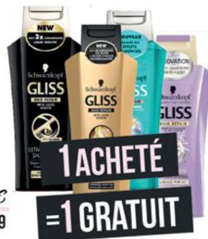
Shampooing Gliss Schwarzkopf différentes variétés 250ml