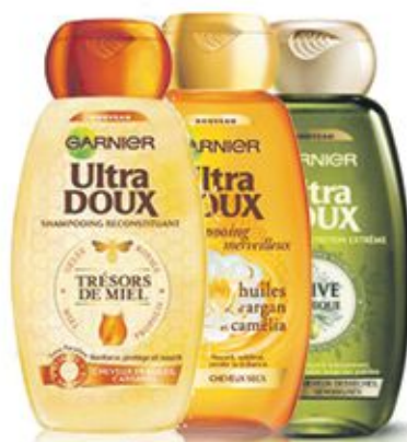
Ultra Doux Shampooing multiples variétés 250ml