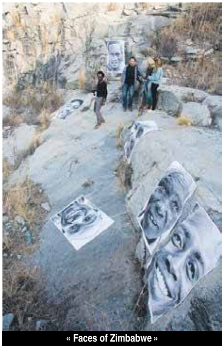
« Faces of Zimbabwe »

A vos appareils photos ! Le service Culture de la Collectivité met en œuvre cette idée originale de création d'une exposition géante et à ciel ouvert de photographies de portraits sur les murs publics : Le « Faces of Saint-Martin ».