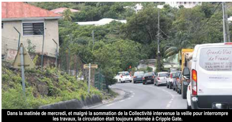
Dans la matinée de mercredi, et malgré la sommation de la Collectivité intervenue la veille pour interrompre les travaux, la circulation était toujours alternée à Cripple Gate.

La pagaille sur les routes qui a eu lieu la journée de mardi et une partie de la journée de mercredi met en exergue la fragilité d'un fonctionnement et notamment l'absence de coordination et de communication entre les services de la Collectivité.