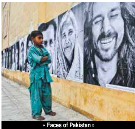
« Faces of Pakistan »

Avec ce projet de « Street Art » totalement novateur pour Saint-Martin, le service culture de la Collectivité marque ici sa volonté de s'inscrire dans la diffusion d'un art moderne et participatif. En réalisant les photographies ou en étant les sujets des portraits photographiés, ce sont les habitants de Saint-Martin qui sont ici mis à l'honneur. Et dans les regards ou les postures, les photographies seront porteuses de messages. Des messages donnés par la population à la population. Un voyage à cœur ouvert et à regards plongeants, mêlant acteurs et spectateurs. Du made in Saint-Martin. V.D.