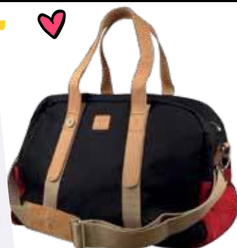
Travel bag. finitions cuir et daim Faguo

SUNSET BVD à Marigot 49 rue de la liberté 0690 77 14 86