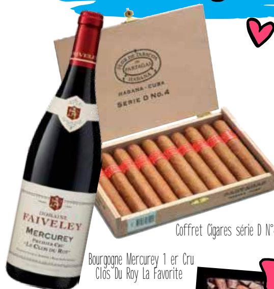
Bourgogne Merceury 1 er Cru Clos Du Roy La Favorite