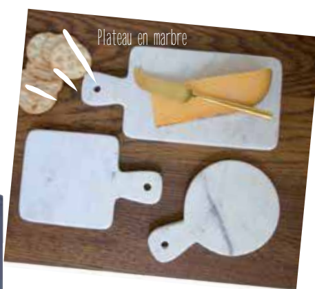
Plateau en marbre