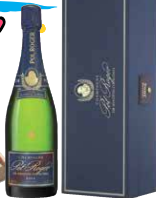
Coffret Cigares série D N°4 Champagne Pol Roger Cuvée Sir Winston Churchill 2006