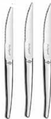
Set de couteaux Lou Laguiole

Ma jolie directrice passage de la marina royale à côté de René Derly 0690 53 67 26