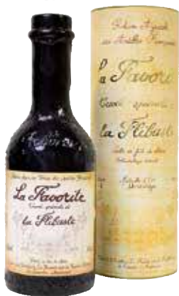
Rhum La Favorite Cuvée spéciale de la Flibuste 1993