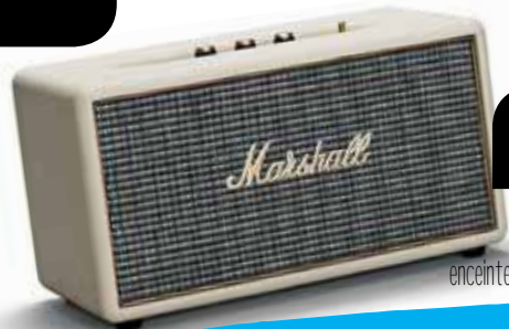
enceinte bluetooth Marshall acton 339 €

VOU DRO à Marigot - Marina Royale 05 90 29 46 63