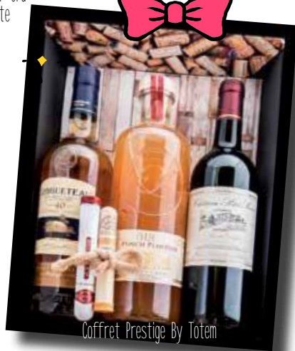
Coffret Prestige By Totem

TOLEMWINE A HOE estate - anciennement boutique orange 05 90 27 54 89