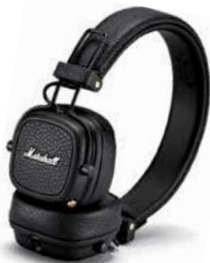
casque Marshall Major III Bluetooth 159 €