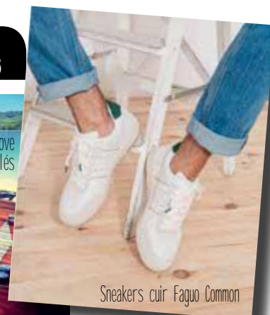
Sneakers cuir Faguo Common