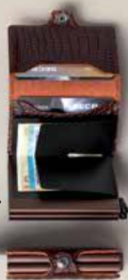
porte-cartes cuir fonctionnel secrd