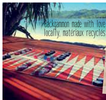
Backgammon made with love locally, matériaux recyclés

SUNSET BVD à Marigot 49 rue de la liberté 0690 77 14 86