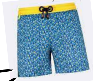
Maillot Gil's fast dry Yellow Tulips

Ma jolie directrice passage de la marina royale à côté de René Derly 0690 53 67 26