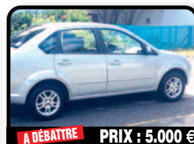
A DÉBATTRE PRIX : 5.000 €

DODGE DAKOTA : Dodge dakota v6 4x4 Bon état général Petit travaux de carrosserie à prévoir. Année 2005, Essence, 117482 kilomètres, Auto. Tél : 06 90 86 19 73