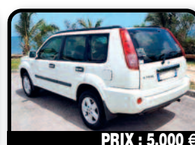
PRIX : 5.000 €

FORD FIESTA SEDAN : 1ere main. Très bien entretenue. Bon suivi pour les services ces 9 années. À voir et à essayer. Année 2009, Essence, 49500 kilomètres, Manuelle. Tél : 06 90 59 86 23