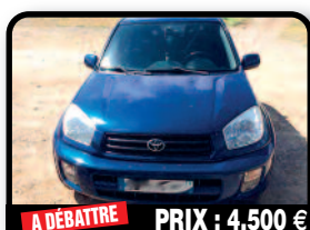
A DÉBATTRE PRIX : 4.500 €

TOYOTA RAV 4 : 2.0 VVTI 150 Cv Année 2001 made in Europe boîte vitesse mécanique 4 vitres électriques teintées, climatisation, direction assistée, barres de toit jantes alu, attache remorque amovible Contrôle technique ok. Tél : 06 90 77 52 17