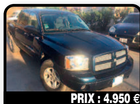
PRIX : 4.950 €

NISSAN TIIDA 2009 : 60500 Km Contrôle technique OK Bien entretenue Disponible à partir du 07/07/2017. Tél : 06 90 66 91 25