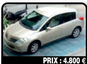
PRIX : 4.800 €

HYUNDAI I20 - 2012 : 2012, 53.000 kms, boîte auto., Vitres teintées, Plaques d'immatriculation hollandaises, contrôle technique OK. Batterie neuve juin 2017, facture à l'appui avec garantie 6 mois. Tél : 06 90 59 30 38