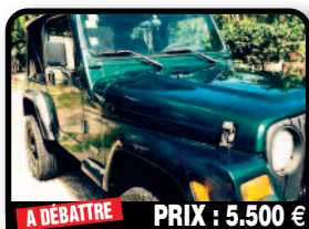
A DÉBATTRE PRIX : 5.500 €

NISSAN X-TRAIL : blanche en très bon état, carrosserie et intérieur propres. CT en cours. Année 2007, Essence, 100000 kilomètres, Auto. Tél : 06 90 84 14 31