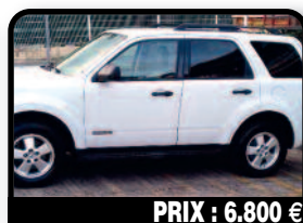
PRIX : 6.800 €

KIA PICANTO : 1ère main, modèle décembre 2012, couleur grise métallisée, entretien et révisions régulières chez soremar facture à l'appui, 4 pneus neufs, boîte automatique, système de verrouillage avec alarm... Essence, 72500 kilomètres, Auto. Tél : 06 90 76 17 81