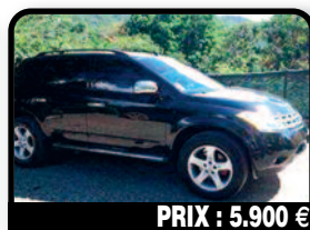
PRIX : 5.900 €

NISSAN XTRAIL : 2004. Bon état, roule parfaitement. Pneus neufs à l'avant changés début juillet. Crémaillère de direction neuve changé début juillet. Facture à l'appui. Dernier CT ok en décembre 2016. Disponible à partir de août. Tél : 06 90 22 54 09