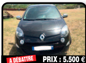
A DÉBATTRE PRIX : 5.500 €

JEEP WRANGLER 1998 : Boîte automatique / Essence / Bon état général Contrôle technique OK 4 pneus neufs, véhicule bien entretenu + factures. Essence, 120000 kilomètres. Tél : 06 90 19 42 02