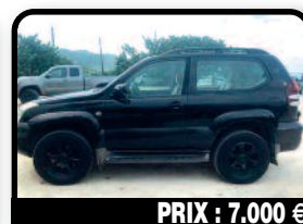
PRIX : 7.000 €

KIA SOUL : en très bon état sauf carrosserie côté droit, très bien entretenue, 2ème main mais vidange faite tous les 5000 km, très fiable aucun frais à prévoir. sera vendu avec CT ok, pneus presque comme neufs. Tél : 06 90 77 42 76