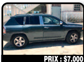
PRIX : $7.000

FORD F150 : Strong work truck can carry 1.5ton material. Price negotiable. Année 2006, Essence. Tél : 001 721 586 9705