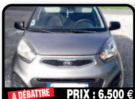
A DÉBATTRE PRIX : 6.500 €

JEEP COMPASS : 2007 Jeep Compass very low mileage. Tél : 001 721 586 5886