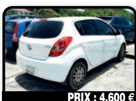
PRIX : 4.600 €

TOYOTA RAV 4 : 2.0 VVTI 150 Cv Année 2001 made in Europe boîte vitesse mécanique 4 vitres électriques teintées, climatisation, direction assistée, barres de toit jantes alu, attache remorque amovible Contrôle technique ok. Tél : 06 90 77 52 17