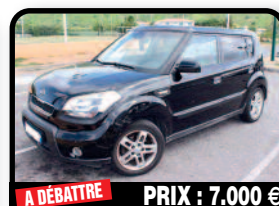
A DÉBATTRE PRIX : 7.000 €

FORD ESCAPE XLT 2008 : 4 CYLINDRES Très bon état. C avec regret que je me sépare de cette voiture!!! Pratique et économique. 6800 euros. Année 2008, Essence, 116000 kilomètres, Auto. Tél : 06 90 35 68 25