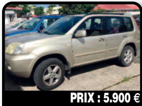
PRIX : 5.900 €

TWINGO : noire, 1,2L finition Trend en parfait état intérieur, extérieur et mécanique. Belles finitions peinture, récente, peu de km (51 000km), essence, boîte manuelle. Tél : 06 90 15 45 07