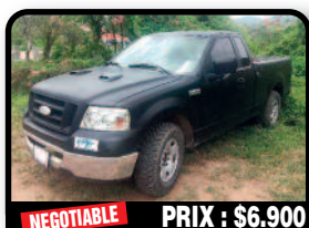
NEGOTIABLE PRIX : $6.900

MINI COOPER CABRIOLET : Vend mini cooper cabriolet Année 2006 Boîte automatique Intérieur cuir Capteur de recul 1000€ de frais à prévoir. Année 2006, Essence, 37014 kilomètres, Auto. Tél : 06 30 82 24 95