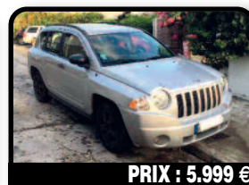
PRIX : 5.999 €

NISSAN MURANO : noir 2005 bon état Bobines, boîte de vitesse, 1 pneu, batterie neuve, une crémaillère (factures à l'appui). Année 2005, Essence, 120000 kilomètres, Auto. Tél : 05 81 43 02 61