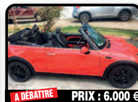
A DÉBATTRE PRIX : 6.000 €

JEEP COMPASS 2008 AUTO : Bon état quelques rayures et coups sur la carrosserie. Carte grise française. Motorisation: 2,4L VVT CT: Ok Jantes alu noirs + écrous anti-vol. Climatisation. Radio Cd + prise auxiliaire. Tél : 06 90 43 68 19