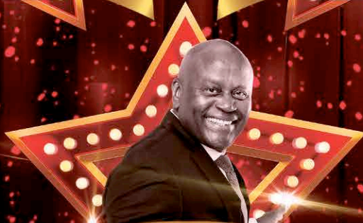
King BeauBeau & The Sugar Apple Band (Sint Maarten)