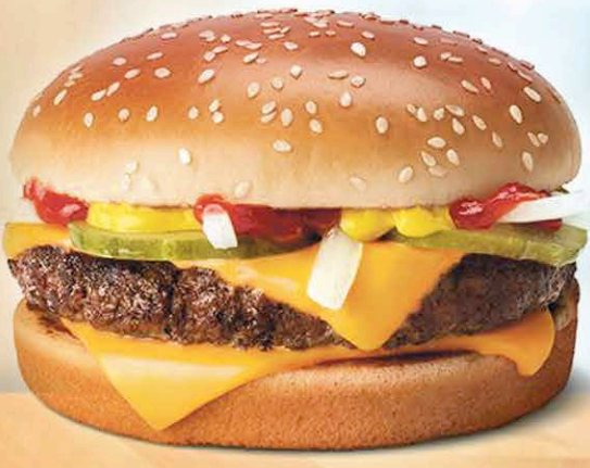
Quarter Pounder with Cheese

McDonald's Marigot - Simpson Bay - Belvedere