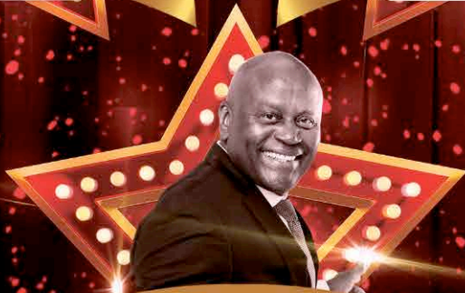
King BeauBeau & The Sugar Apple Band